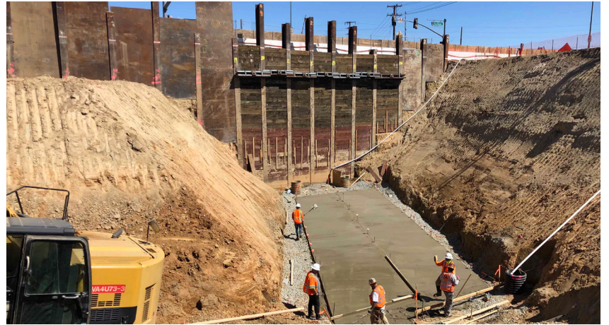
Las cuadrillas trabajando en Jurupa Road junto a Van Buren Blvd.